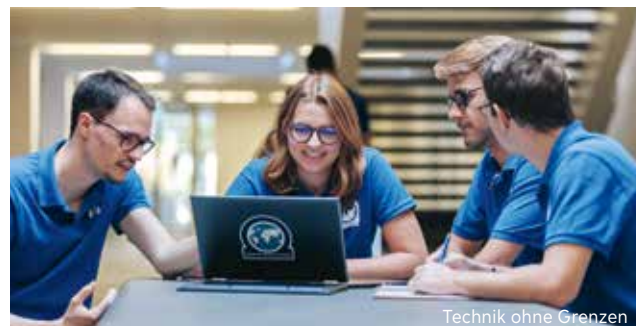
Technik ohne Grenzen